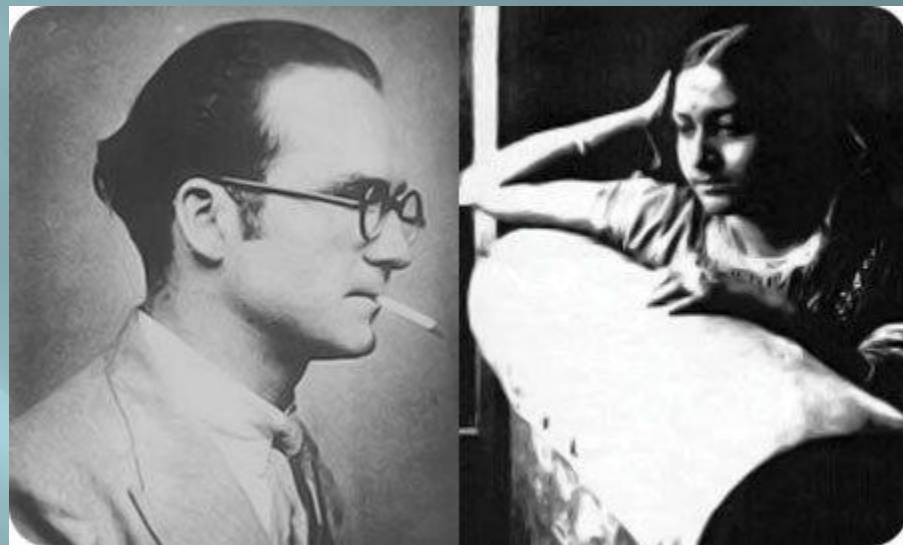
Foto: Mircea Eliade si Maitreyi Devi